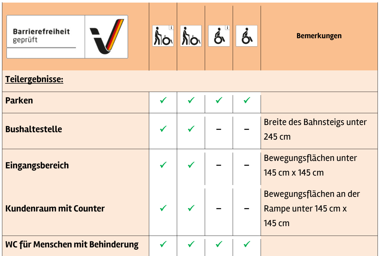
Tabelle 1: Überblick über das Prüfergebnis