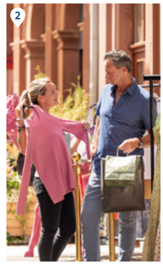
1 Speyer erkunden. 2 Auf Shopping-Tour.