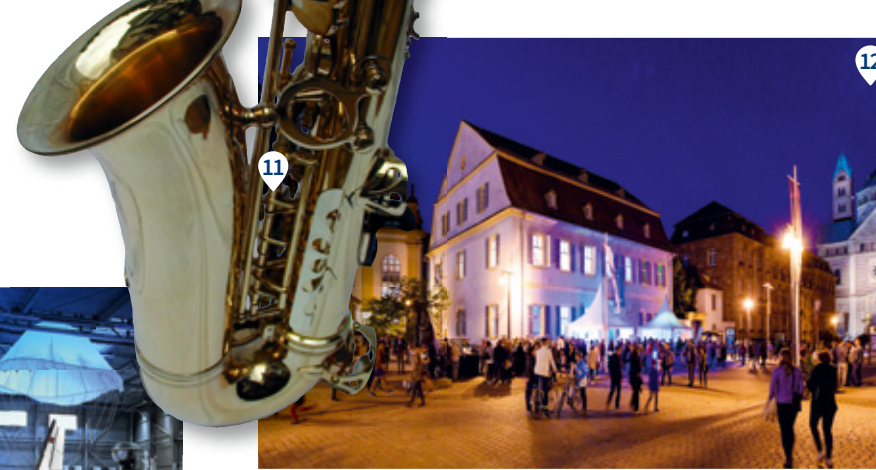
11 Jazz im Rathaus Hof. Live-Jazz. 12 Kult(o)urnacht. Für Nachtschwärmer.

Kulturhof Flachsgasse Wechselnde Sonderausstellungen vom Speyerer Kunstverein und der Städtischen Galerie, Flachsgasse 3 Feuerbachhaus Speyer Museum mit Werken von Anselm Feuerbach, Allerheiligenstraße 9