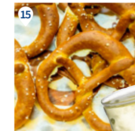
13 Kaffeehauskultur. 14 Pfälzer Lebenslust. 15 Die Brezel. Speyers Traditionsgebäck.