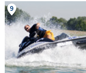
8 SEA LIFE. Faszinierende Unterwasserwelt. 9 Wasserskischule Becht & Partner. 10 TECHNIK MUSEUM Speyer.