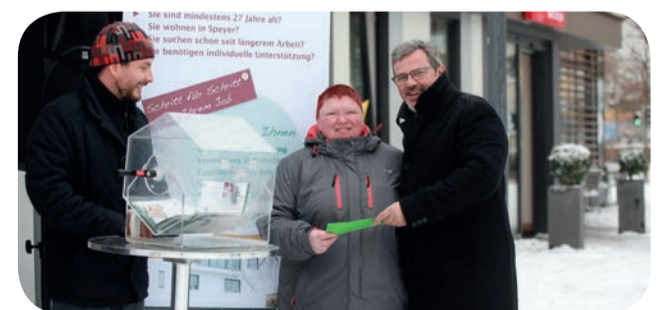
Ziehung der Gewinner auf dem Adventsmarkt

Aktuell engagiert sich BIWAQ für die Einrichtung eines Qualifizierungs- und Integrationszentrums im Leerstand der Lessingstraße 13, um damit die Nahversorgung sowie die Sicherung und Schaffung von Arbeitsplätzen sicherzustellen.