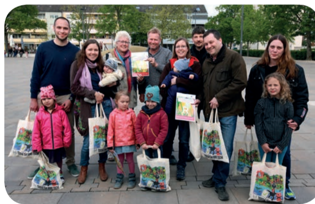
Gewinner der Osteraktion bei der Preisübergabe

In den vergangenen zwei Jahren wurde an diesem Ziel gearbeitet und gemeinsam mit den Unternehmen in Speyer-West die Kampagne „wir sind dabei“ entwickelt. Dazu gehören zum Beispiel die Gutschein- und Gewinnaktionen zur Oster- und Weihnachtszeit. In regelmäßigen Abständen werden die Unternehmen auf der Programm-Homepage vorgestellt: http://www.speyer.de/biwaq .