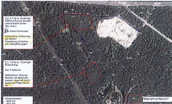
Auszug aus Maßnahmenkarte der SV SP: externe Kompensationsflächen

bereits festgesetzt wurden, ist nachzuweisen, ob sich auch im Rahmen des immissionschutzrechtlichen Verfahrens zur BRS die Erforderlichkeit von externen Kompensationsflächen ergab. Lt. Mail von Büro Piske vom 19.12.2023 sind hierzu nach Auskunft der Stadtverwaltung Speyer, Abteilung Umwelt, Forsten... auch drei externe Ausgleichsflächen im Nordwesten, Westen und Südwesten der BRS immissionsrechtlich genehmigt worden. Diese sind dann aber auch fachgerecht vollständigshalber im BPL incl. Auswertungsmaßnahmen mit festzusetzen.