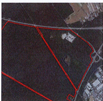
Auszug aus Objektreport Biotopkomplex

Im Gegensatz zu den Planungsunterlagen (Beschlussvorlage...) tangiert und überlagert der aktuell im Verfahren befindliche Geltungsbereich auch das v.g. Vogelschutzgebiet!