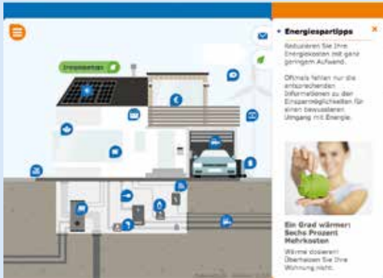
Das SWS-EnergieHaus zeigt Ihnen Einsparpotenziale auf.