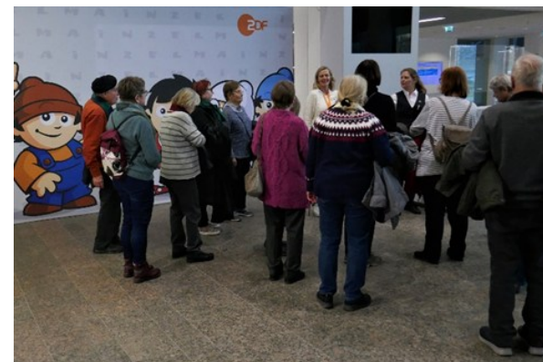
Tagesfahrt nach Mainz, ZDF-Studio

Es ist keine Rücknahme von bereits gekauften Teilnahmekarten möglich.