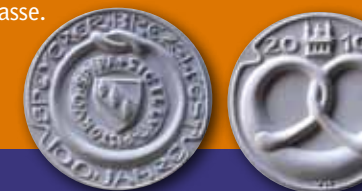
Foto nach dem Clipsmodell

FR: 18.00 – 22.00 Uhr SA: 14.00 – 22.00 Uhr