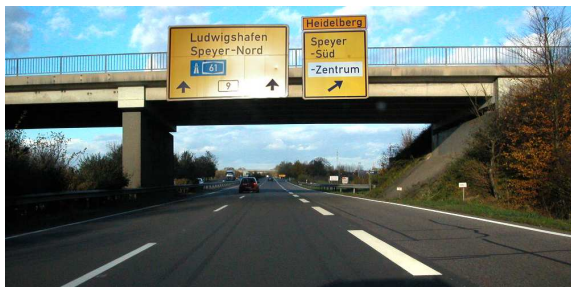
1. Die B 9 an der Abfahrt Speyer-Süd/Zentrum verlassen.

• Von Germersheim / Wörth auf der B 9 bis Speyer fahren. Von hier aus weiter, wie unten beschrieben.