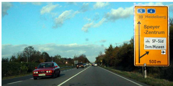
3. Kurz vor der Rheinbrücke die B 39 auf der Abfahrt Speyer-Zentrum / Dom verlassen und sich in der mittleren Spur einordnen.