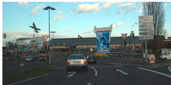
4. An der Ampel mit Blickrichtung Technik-Museum die Kreuzung überqueren und in die Straße Am Technik-Museum fahren.