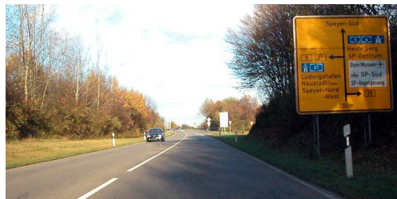
2. Kurz vor Speyer-Süd nach rechts auf die B 39 Richtung Heidelberg, Speyer-Zentrum abbiegen.